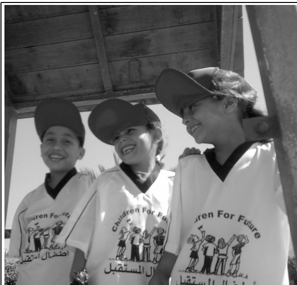
Kinder im Sommerferienlager

- Kinderreiche Familien, die durch den Krieg obdachlos geworden sind, stehen vor dem Nichts. Rund 100 $ an monatlicher Soforthilfe könnten die größte Not lindern;